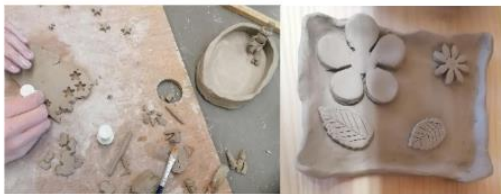
Fertigung von Seifenschalen in Aufbautechnik