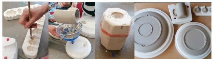
Fertigung von Geschirr und Dekorationen in Gießtechnik

Glasierte Seifenschalen noch vor Weihnachten im Weltladen erhältlich